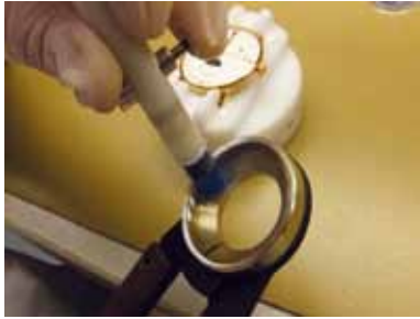
Schritt 8: Die Glasunterseite vor der Montage reinigen.