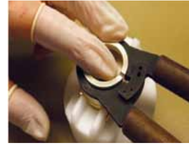
Schritt 11: Die Glaszange auf die Uhr aufsetzen und entspannen. Das Glas beim Abheben der Zange mit dem Finger leicht nach unten aus der Glaszange drücken.