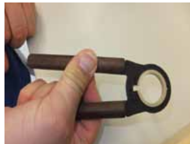
Schritt 14: Glaszange durch Druck nach außen öffnen und Einsatz entnehmen.