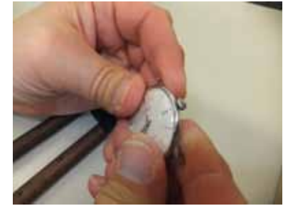
Schritt 12: Mittels leichtem Druck auf das Glas überprüfen ob das Glas fest sitzt. Das Glas rastet gegebenenfalls ein.