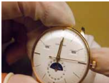
Schritt 12 A: Kontrolle auf korrekten Sitz des Distanzrings. Der Distanzring darf nicht sichtbar sein.