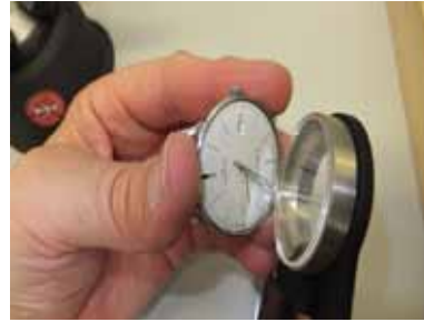
Schritt 10: Das Glas passgenau an den inneren Gehäuserand ansetzen. Die Glaszange entspannen und abheben.