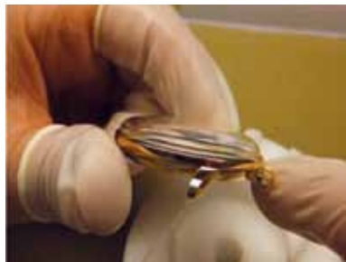
Schritt 13: Kontrolle auf korrekten Glassitz.